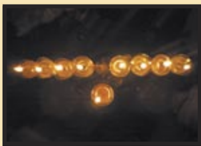
לא היה נס! ■