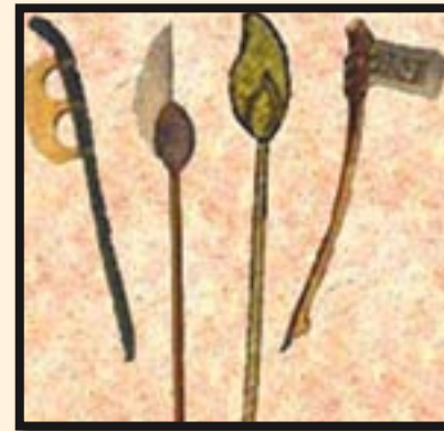
אומר הנביא: ש'וסקה תהיה לצל..

כתוב: 'והיה כאשר תריד ופרקת עלו מעל צנארה' (בראשית כ"ז, ה'), מה הכונה ב'תריד'? שאדם מחליט שיש תרי"ד מצוות במקום תרי"ג - זה נקרא