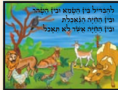
להבדיל בין הטמא ובין הטהור ובין הטהור הנאכלת ובין הטהור אשר לא תאכל

"ויבדר ד' אל משה ואל אהרן לאמר אלהם: דברו אל בני ישראל לאמר זאת החיה אשר תאכלו..." (ויקרא י"א, א' - ב')