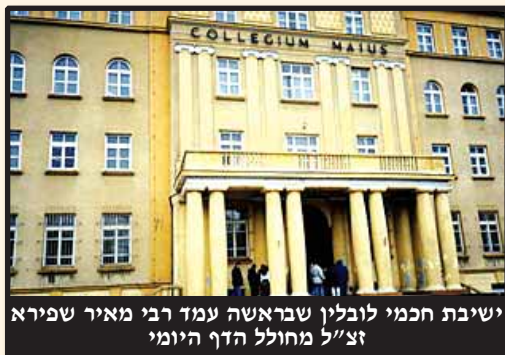
ישיבת חכמי לובלין שבראשה עמד רבי מאיר שפירא זצ"ל מחולל הדף היומי

וגם אמרו בתענית ז': 'למה נמשלו דברי תורה כאש, שנאמר "הלא כה דברי כאש נאם ד'" לומר לך מה אש אינו דולק יחידי, עץ א' אינו דולק אלא ב' או ג' יחד, אף דברי תורה אין מתקיימין