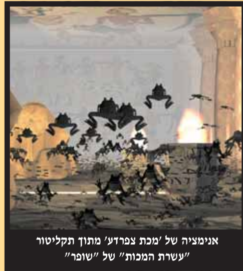
אנימציה של 'מכת צרדע' מתוך תקליטור "עשרת המכות" של "שופר"

אומר ה"חתם סופר": הגמרא אומרת (סוכה יד'). כתוב: "ויעתר יצחק אל ד'". למה נמשלו תפילתם של צדיקים לעתה? לומר לך מה עתר מהפך את התבואה בגורן ממקום למקום, אף תפילתם של