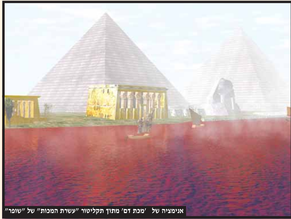
אנימציה של 'מכת זם' מתוך תקליטור 'עשרת המכות' של 'שומר'

כעבור חדשיים קבלו את התורה ואז נהיינו לעם וזה היה השלב הרביעי. וכל הנ"ל מדויק בפסוקים: "והוצאתי אתכם מתחת סבלות מצרים" - זה היה השלב הראשון שלא יסבלו יותר. שלב שני - "והצלת אתכם מעבודתם לגמרי" . שלב שלישי - "וגאלתי אתכם בזרוע נטויה ובשפטים גדולים" . והשלב הרביעי - "ולקחתי אתכם לי לעם" זה היה מתן תורה. ואז דברי הגמרא מובנים: "ארבע כוסות - דרך חירות תיקנו חכמים": כמו