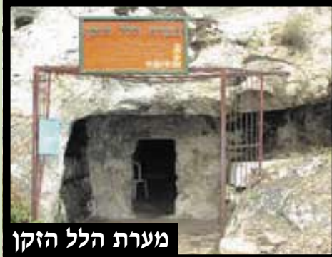
מערת הלל הזקן

הנתינה. כבר כשנולד התינוק וקצת מבין, עדיין בקושי מדבר, אומר ככל הילדים על כל חפץ: זה שלי, זה שלי. מתוכח על כל דבר. קודם כל אני, אני, אני, שלי ובשבילי.