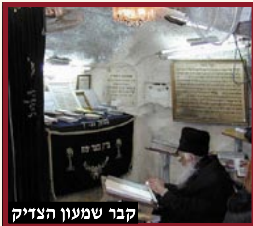
קבר שמעון הצדיק

הכל הגיע אלינו בזכות השלמות של יעקב אבינו שקנה בביתו של לבן, הכל בזכות שהוא היה "מבין" ולא נפל ברוחו. בדעבד, לאחר מעשה, אנחנו מסתכלים לאחור וחושבים שזו היתה תקופה של זהב עבור יעקב אבינו, אבל צריכים להבין שזו היתה גלות מרה מאד עבורו. לבן היה ממש השונא הגדול שלו כמו שכתוב בהגדה של פסח שהיה גרוע מפרעה מלך