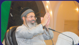
תמונות מהרצאותיו של הרב אמנון יצחק שליט"א בשבוע שעבר באשדוד וירושלים

וכ"ז שאין מוכיחם, ישבחוהו, כי הוא איש תמים אוהב שלום ואמת. דהיינו; "איש צדיק תמים ה'ה בדרתיו". שחשבוהו כולם ל"צדיק תמים" ומרחמו ליה. והטעם מפני ש"אַתְּ הַצְּדִיקִים