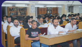
תמונות מהרצאותיו של הרב אמנון יצחק שליט"א בשבוע שעבר בכולל באלעד, אילת ובסליחות במוצ"ש

בפ' 'תבוא' ישנן צ"ח קללות איומות ונוראות, יוצאות מפי הקב"ה מקור החסד והרחמים. וְאֵיתָא בְּחַז"ל; 'בִּשְׂעָה שֶׂאֲדָם מִצְטַעַר שְׂכִינָה מֵה לְשׁוֹן אֹמֶרֶת? קִלְנֵי מֵרָאשֵׁי קִלְנֵי מִזְרוּעֵי' (סנהדרין' מו) . וכאן גדול הכעס עד שהכתוב מעיד שהגוים יתמהו וישאלו; "מֵה חָרִי הָאֵף הַגָּדוֹל הַזֶּה". וְמֵהִי הַתְּשׁוּבָה? "עַל אֲשֶׁר עָזְבוּ אֶת פְּרִית ה' אֲלֵקֵי אֲבֹתָם" (שם' פס' כד) . והיינו; שבשביל תיקון החטא צריכים להצטרף ולהזדכך בכור היסורים הזה. וְאִפְשָׁר לֹמַר; כִּי כֹל עֵיקַר הַתּוֹכַחָה הוּא לְהִרְאוֹת לְאָדָם שְׂכַל אִמְתְּלוֹתָיו הֵן בְּטִלוֹת, כְּמוֹ לְמַשֵּׁל שֶׁהָאָדָם טוֹעֵן שְׂאֵינְנוּ יֹכֵל לְהִיּוֹת אֲכֹזֵר עַל בְּנֵי בֵיתוֹ. וְאִי אִפְשָׁר לְקַיֵּים אֶת הַדְּרֵשׁ שֶׁל; "שְׁחִירוֹת פְּעוֹרָב" (ש"ה' ש' ה יא) בְּמֵי שְׂמֵשִׁים עֲצָמוֹ אֲכֹזְרֵי עַל בְּנֵיו וְעַל בְּנֵי בֵיתוֹ כְּעוֹרָב' (עירובין' כב) . וכן טוען האדם שאי אפשר לו לחיות חיים של בטחון בשם ולהסתפק בפת בסלו, על כך באה כלפיו התוכחה להצביע בפניו כי יכול יוכל, מראים לו לאדם