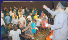
תמונות מהרצאותיו של הרב אמנון יצחק שליט"א בשבוע שעבר ביבנה, דימונה ואשקלון

ב'פרשת ביכורים' נאמר: "ובאתך אל הפקדן אשר יקנה פנימים קהם ואמרת אליו שאינך כפוי טובה" (רש"י). הרי צריך להגיד 'פרשת ביכורים' בפה מלא. משם ראה שצריך להביע הכרת הטובות שעושים לנו בני אדם. וגם נביע במלים שאנחנו מכירים טובתם. ואיננו צריכים לחפש טובות גדולות; המוכר בחנותו ומטריח עצמו למצוא בשבילנו בדיוק כל מה שאנו מבקשים לקנות והדוור המביא לנו מכתבים, האם זאת אינה טובה? ומי שמגיש לנו אוכל ומי שמנקה את ביתנו? לכולם יש להכיר טובתם ולכולם מגיעה מלה טובה! ומכש"כ, מי שעשה עמנו חסד יותר גדול! אם נתלמד ונתרגל בזה, ניוכח לראות שהעולם מלא חסד. ובהכירנו זאת תתרבה בנו חיבה ורעות במידה רבה שלא ידענו מזה עד כה. הכרת הטובה היא מידה שהשכל מחייב ומידה יפה היא מאד. למה אנחנו כפויי טובה לרוב? כפיית הטוב המושרשת בנו עוד מאדה"ר? הרי אמרנו: "נכד ה' לקאת את העיר נאת המגדל אשר פנו בני האדם" (בראשית