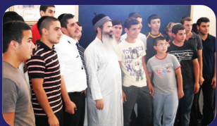
תמונות מהרצאתו של הרב אמנון יצחק שליט"א בשבוע שעבר בכולל בנהריה

הבחינה השלישית ; הוא מה שהרבה שואלים, על אלה שכל עוד הם בין כתלי הישיבה שומרים על תוארם, אבל מיד כאשר יוצאים לחוץ נטמאים כי קולטים את השפעת הרחוב ואינם מבינים למה