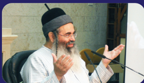
תמונת מהרצאתו של הרב אמנון יצחק שליט"א בשבוע שעבר בנהריה

תמן תנינן ("חולין" עא.); "האשה שמת ולדה במעיה והושיטה החיה ונגעה בו, החיה טמאה טומאת ז" והאשה טהורה עד שיצא הולד. המת בבית (בבטן האשה מ"כ) הבית טהור. יצא מתוכו הרי הוא טמא. מי עשה כן? מי צוה כן? מי גזר כן? לא יחידו של עולם"? תמן תנינן ("פרה" ד); "העוסקין בפרה מתחילה ועד סוף מטמאין בגדים. היא גופה מטהרת בגדים. אמר הקב"ה: "חוקה חקקתי, גזרה גזרתי, אי אתה