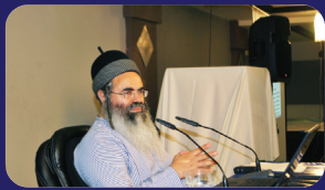
תמונות מהרצאתו של הרב אמנון יצחק שליט"א בשבוע שעבר בבתי ים וגדרה

אמנם ראינו כי יש לך אדם המונה את הדבר החביב לו אף בידעו את מספרו, אבל זהו ג"כ מרפיון בהירות הידיעות אצל האדם, שאף בדברים הידועים לו רוצה הוא לראות בעיניו ולספור אותם, למען דעת יותר ברור את מספרם. אבל מי איכא ח"ו ספיקא קמי שמיא? ואם ישנם אנשים אוהבי כסף הנהנים ממעשה המנין עצמו, כפי שמצוי באנשים שפלים, 'עכברי דשכבי אדינרי' , אין זה אלא רגש שפל שלא נוכל