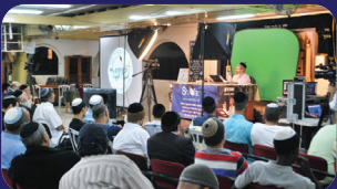
תמונות מהרצאות של הרב אמנון יצחק שליט"א בשבוע שעבר בטירת הכרמל, פתח תקוה ואשקלון