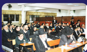
תמונות מהרצאתו של הרב אמנון יצחק שליט"א לפני שבועיים בעפולה וירושלים