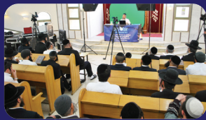
תמונות מהרצאתו של הרב אמנון יצחק שליט"א בשבוע שבער בכולל בעמנואל

אם איוב התגעגע ל"נֹחֵי קֶדֶם", כאשר הכל מחבקין ומנשקים אותו, הרי שיש איזה יתרון באותם ימים שאיננו קיים כאשר האדם מתבגר. בתינוק טמון איזה חן מיוחד שהוא סגולה אלקית החסר לאנשים מבוגרים וגדולים. הגעגועים והקנאה לאותה סגולה מיוחדת שישנה בתינוק. מהי סגולה זו? אמרו חז"ל ('ע"ז ג'); 'ברביעית, מאי עביד? יושב ומלמד תינוקות של בית רבן תורה'. במעי אמו מלמדין אותו תורה ע"י מלאך והוא צופה נסתרות בעליונים. מעבירין אותו בכל העולמות, נר דלוק