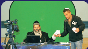
תמונות מהרצאתו של הרב אמנון יצחק שליט"א בשבוע שעבר בטבריה

המחיר המדוייק יקבע בהתאם לגיל. התנאים המלאים והמחייבים הינם אלה המפורטים בתנאי הפוליסה ו/או כתב השירות.