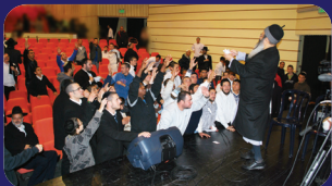
תמונות מהרצאות של הרב אמנון יצחק שליט"א בשבוע שעבר בנשור

"וַיִּדְבֹּר אֲלֵקִים אֶל מֹשֶׁה וַיֹּאמֶר אֵלָיו אֲנִי ה'" (שמות' ו). 'מהו 'אָנִי ה'?" אע"פ שאמרתי לך: "רְאֵה נִתְיַדֵּד אֲלֵהִים לְפָרְעֵה" (שמות' ז) לא אתה אלהים כי אם לפרעה, אך אני ה' גם לך' (בעתו"ס 'וארא'). הזהירות מזחות דעת, הוא נאה אף לחכמים ואנשי רוח, אף לאיש האלקים באה האזהרה, דוקא השראת השכינה על האדם, מסוכנת היא לו, שלא יבוא לידי זחיחות דעת. וכמ"ש רש"י: 'אם לא שנשטעתי שכינתי ביניכם, לא גבה לבבכם ליכנס לכל הדברים הללו'. לומדים אנו מכל הנאמר; עד כמה צריך האדם להתפלל שיהא בעל זכות, שיזכה להצלחה בעסקיו ובמעשיו הרוחניים לעלות מעלה מעלה, אך צריך האדם לכוון גם בתפלה מיוחדת שלא תזוח דעתו עליו, שלא יגבה לבו ולא ידבר גבוהות וגדולות, אחרי שהשכינה נטועה בקרבו, לא יעריך את עצמו ולא יתלה עליותיו בכחו, אלא יזקוף את כל הצלחתו בהשי"ת, לו הגדולה ולו הטהילה. (אור חדש'). ■