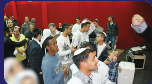
תמונות מהרצאתו של הרב אמנון יצחק שליט"א בשבוע שעבר בקרית עקרון

שני טעמים יש לדבר מה שהקדימו בני ישראל לצאת ממצרים קודם הזמן; ראשית ; משום שכבר היו שקועים כל כך בטומאת מצרים, עד שלא נותרה עוד כל שהות ואילו נתעכבו עוד זמן מה, היו נטמעים כליל בין המצרים ולא היו יכולים לצאת בתור עם ישראל. וזהו: "מקצר רוח" מחמת חוסר כחות רוחניים להחזיק עוד מעמד. ושנית ; משום שקושי השעבוד היה כה גדול, עד שבמשך התקופה הזאת, סבלו בשביל כל ארבע מאות השנים וזהו: "מעבדה קשה" . על כך אומרת לנו התורה ; כי בני ישראל לא קבלו את שני הטעמים הללו; לא של "קצר רוח" ולא של "עבדה קשה" . ולפיכך; לא רצו להאמין כי גאולתם תבוא לפני תום ארבע מאות שנה, כפי שנגזר עליהם. ('פרדס יוסף')