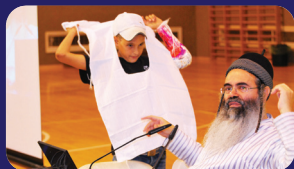
תמונות מהרצאתו של הרב אמנון יצחק שליט"א בשבוע שעבר בשדרות