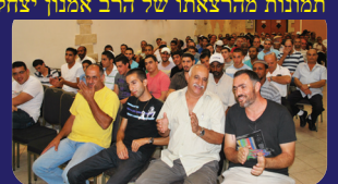
קבל עליו זקן ואשתו נתעברה בתאומים