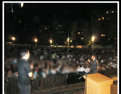
גד אלבו הופיע במעורב בבת-ים בהקפות שניות סוכות תשע"א

מפאת הצניעות אין מפורסמות תמונות רבות ב'גנזי המלך' המראות את הזועה שהתרחשה ב'שמחות הטומאה' ע"י הזמרים שנפסלו ע"י גדולי ישראל, ברחובות הערים בסגנונות של גוים ובשירים שאין להם שום שייכות לשמחת התורה, אלא אך ורק לאגו המנופח של הזמרים הנ"ל. באתר 'שופר' ניתן לראות ולצפות באירועים נוספים מאלה ואת מזמיני האירועים האלה נגד פסק הלכה של הרבנים ברגל גסה.