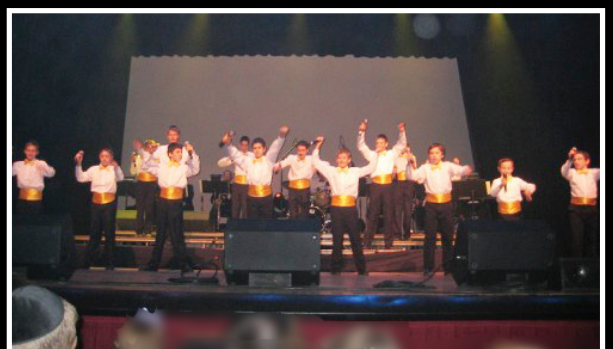
פראי מיאמי הופיעו במעורב בברוקלין קולג' בחוה"מ סוכות תשע"א

מפאת הצניעות אין מפורסמות תמונות רבות ב'גנזי המלך' המראות את הזועה שהתרחשה ב'שמחות הטומאה' ע"י הזמרים שנפסלו ע"י גדולי ישראל, ברחובות הערים בסגנונות של גוים ובשירים שאין להם שום שייכות לשמחת התורה, אלא אך ורק לאגו המנופח של הזמרים הנ"ל. באתר 'שופר' ניתן לראות ולצפות באירועים נוספים מאלה ואת מזמיני האירועים האלה נגד פסק הלכה של הרבנים ברגל גסה.