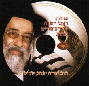
תמונות מהרצאותו של הרב אמנון יצחק שליט"א בשבוע שעבר ברמלה

ניתן להשיג במשרדו שופר רזז מתתיהו 10 בני ברק