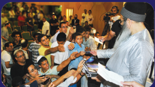
תמונות מהרצאתו של הרב אמנון יצחק שליט"א בשבוע שעבר בראש העין

הנה החסיד רבנו יונה כאחד הראשונים ז"ל מדקדק בכל דיבור ודיבור, אין בו שום מלה יתירה ח"ו וראה; שחזר ושנה ושילש, 'יבין לבבו... וישיב אל לבו... ויאמר בלבו', להורות כי אין החרטה תלויה בהבנת השכל, אלא בהרגשת הלב! כי השכל ודאי מבין; כי רע ומר עזבו את ה'! וכל זמן שלא נשחת שכלו לגמרי,