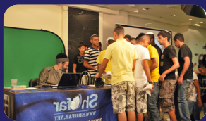
תמונות מהרצאתו של הרב אמנון יצחק שליט"א בשבוע שעבר באזור