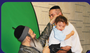
תמונות מהרצאתו של הרב אמנון יצחק שליט"א בשבוע שעבר בנס ציונה

ומצינו בגמרא ('נדה' כ): 'הכם שאסר, אין חברו רשאי להתיר' ופירש הר"ן בשם הראב"ד, הטעם: לא משום