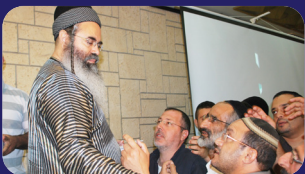
תמונות מהרצאתו של הרב אמנון יצחק שליט"א בשבוע שעבר בנס ציונה

לאזור כפר סבא, הרצליה, רעננה והסביבה - סימה 050-9558033 077-4403314