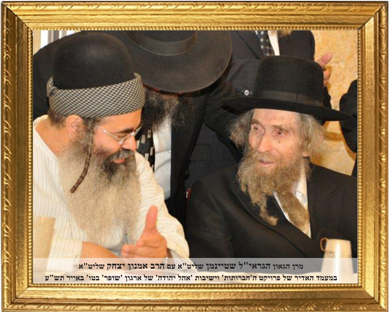
מרן הגאון הגראי"ל שטיינמאן שליט"א עם הרב אמנון יצחק שליט"א במעמד האדיר של פרויקט ה'חברותות' וישיבות 'אהל יהודה' של ארגון 'שופר' בטו' באייר תש"ע