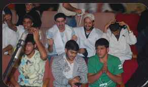
תמונות מהרצאותיו של הרב אמנון יצחק שליט"א ברחבי הארץ בשבוע האחרון