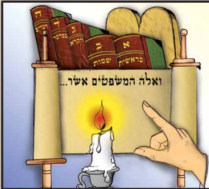
"וְיִצְאָה אִשְׁתּוֹ עִמּוֹ" (כא ג)

וכמו שמצינו בגמרא מסכת 'פסחים' (קיב:): 'ש'ותר ממה שהעגל רוצה לינוק פרה רוצה להניק' ומצינו ב'סנהדרין' (סח:): שהקפיד ר"א על תלמידיו שלא מיצו את מדותיו עיי"ש.