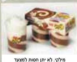
מילקי. לא יתן חסות למצעד

איום החרם הצליח: מכרסמים לא ימונו את מצעד