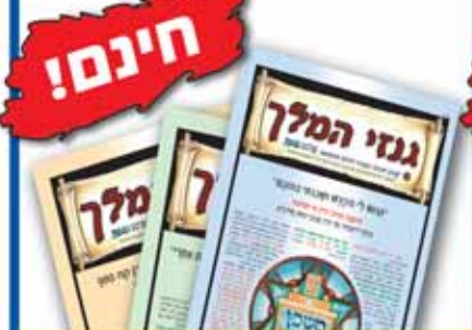
מנוי שנתי ל'גנזי המלך'