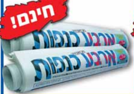
מנוי שנתי לעתון 'ארבע כנפות'