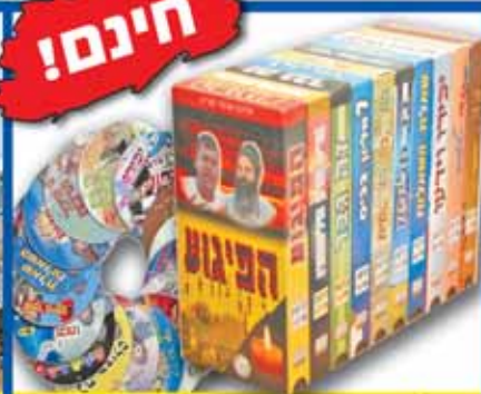
קלטות וידאו, CD, טייפ וספרים