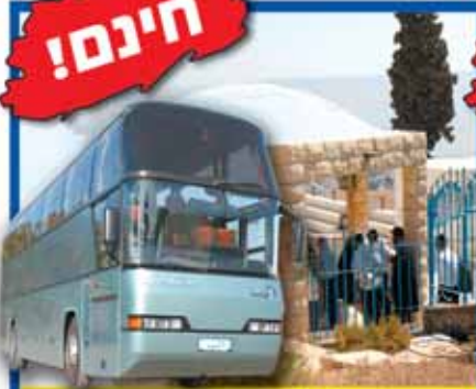
טיול לאתרים בצפון