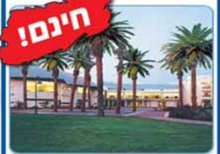
סוף שבוע ששי שבת עם הרב אמנון יצחק