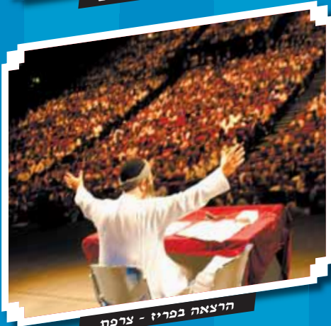
הרצאה בפריז - צרפת