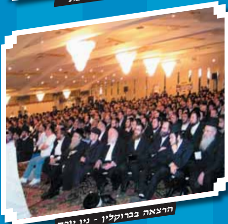
הרצאה בברוקלין - ניו יורק

הרב שממלא אולמות ואיצטדיונים בכל העולם בהופעת בכורה בשווייץ