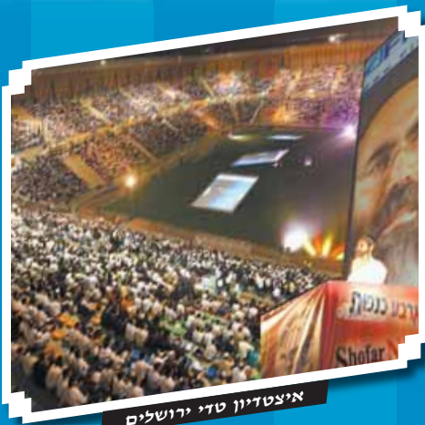
איצטדיון טדי ירושלים