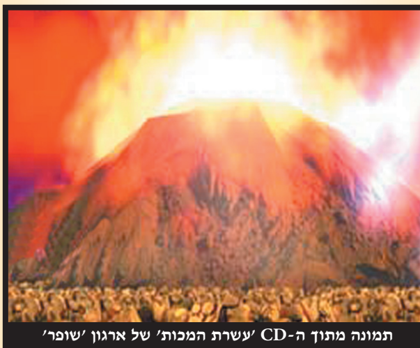
תמונה מתוך ה-CD 'עשרת המכות' של ארגון 'שופר'

וביותר צריך להביין: הרי ההכאה שמסבכת את הנס של שנוי טבע היאור והעפר, הופכת אותם לכלים לקדוש שמו יתברך, אם כן איזה בזיון יש בהכאת משה, אם על ידי שמושם לעבודת ה' מתעלים הם מאד? כמבואר במסילת ישרים פרק א'.