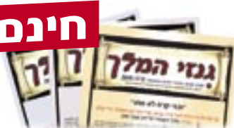
מנוי שנתי ל'גנזי המלך'