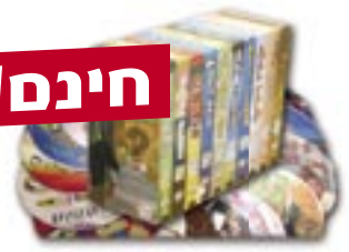
קלטות וידאו, CD, טייפ, ספרים