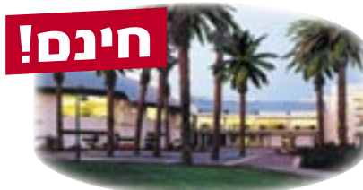
טיול לאתרים בצפון