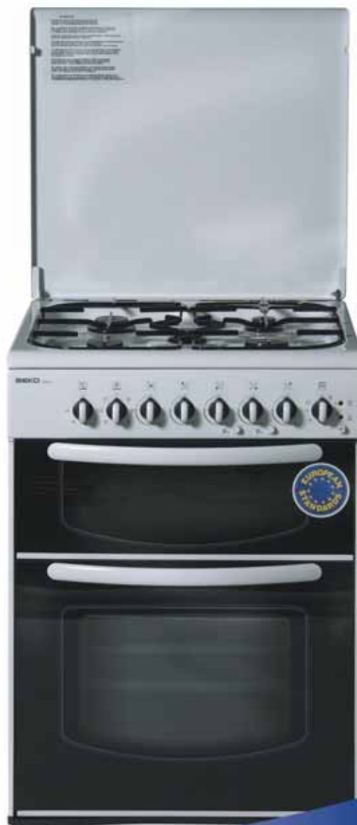
התמונות להמחשה בלבד, ס.ל.ת. **עד 10 תשלומים, תמונה באישור חברות